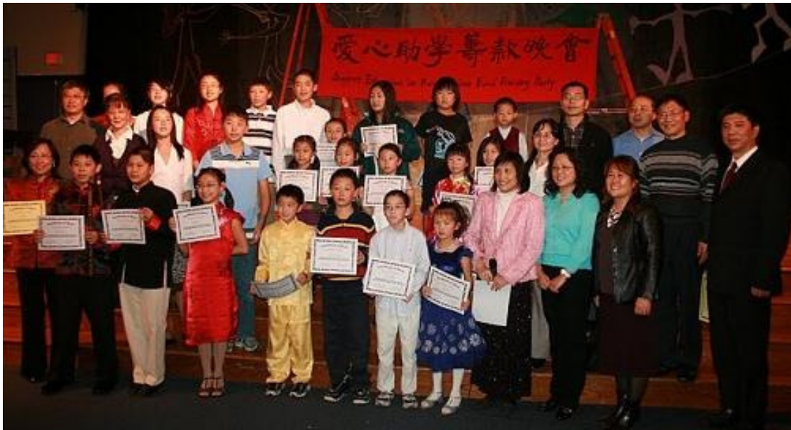
参加爱心募款晚会的学生和家長与校领导、支教小组成员合影留念

今天的高科技速度发展非常的快，记得还在 1950 年的时候，第一台电脑诞生了，虽然它只是一台很普通和简单的电脑，可是大家都觉得很稀奇，偶尔会产生疑问，为什么它能打字，能上网还可以帮你发文件等类似的问题。比起以前，现在的我们把电脑看作是我们生活中不可缺少的好朋友，它是多么的方便啊，当你不知道一些问题的时候，你就可以上网查出来。我们再也不用写信给远方的亲友，又得等好几天信才会被收到。有了电脑以后，只要你给他们发个“Email”，他们会马上收到的。连现在的小朋友们都知道怎么用电脑，他们可以在网上和朋友们聊天、玩游戏等，他们可以去寻找许多的网址。在学校，电脑的用处也很多，我们每天都要查资料，如果去翻书的话，又慢又找不到东西，可是电脑又快知道的知识又多，给我们这些做学生的带来了很大的方便。高科技为我们人类创造了很大的贡献。